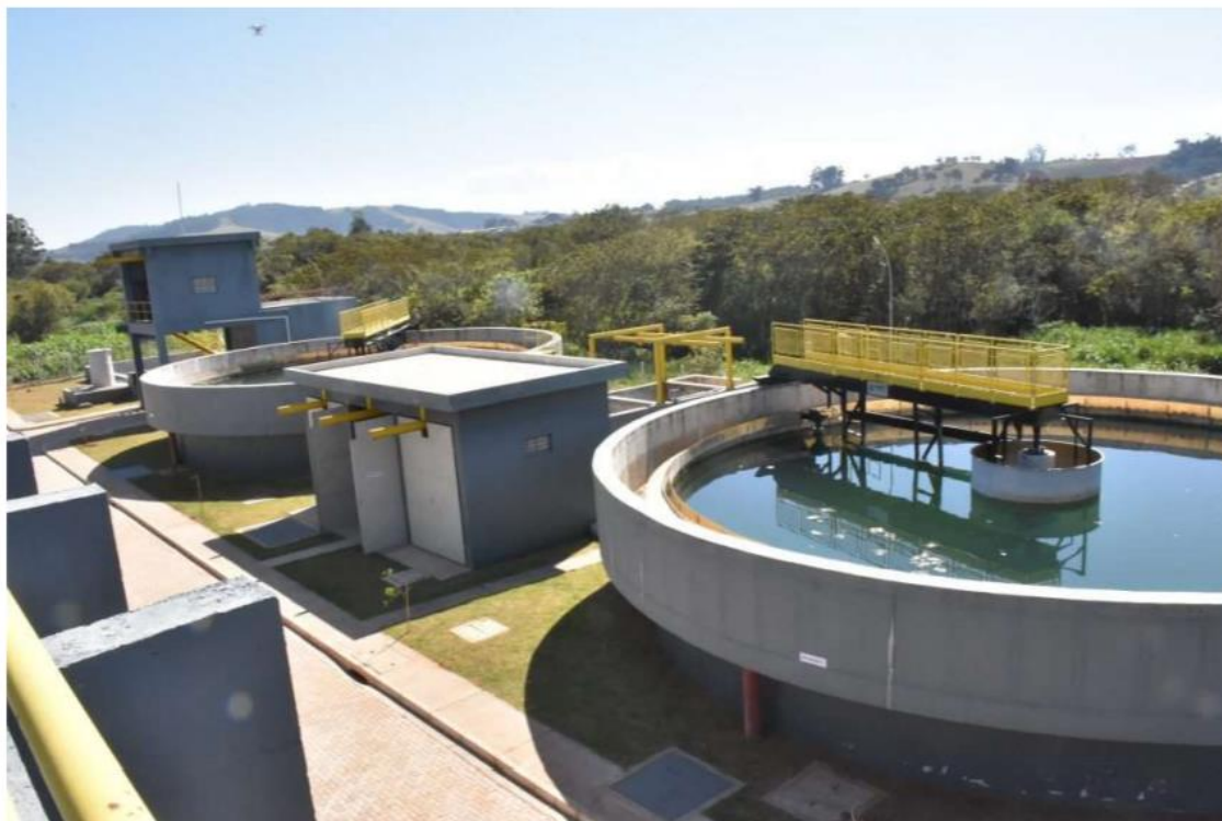
Figura 2 – Estação de Tratamento de Esgoto de Bom Jesus dos Perdões

Cabe destacar que além das questões de saúde, o sistema de coleta e tratamento de esgotos também evita a poluição dos córregos, rios e mares, com a preservação dos recursos hídricos e fontes de abastecimento de água. Neste sentido é importante que o município de Bom Jesus dos Perdões faz parte da Bacia Hidrográfica do Rio Atibainha, que é um contribuinte significativo da Bacia Hidrográfica dos Piracicaba, Capivari e Jundiá responsável pelo abastecimento de uma das regiões mais críticas do estado de São Paulo quanto à qualidade e a quantidade das águas.