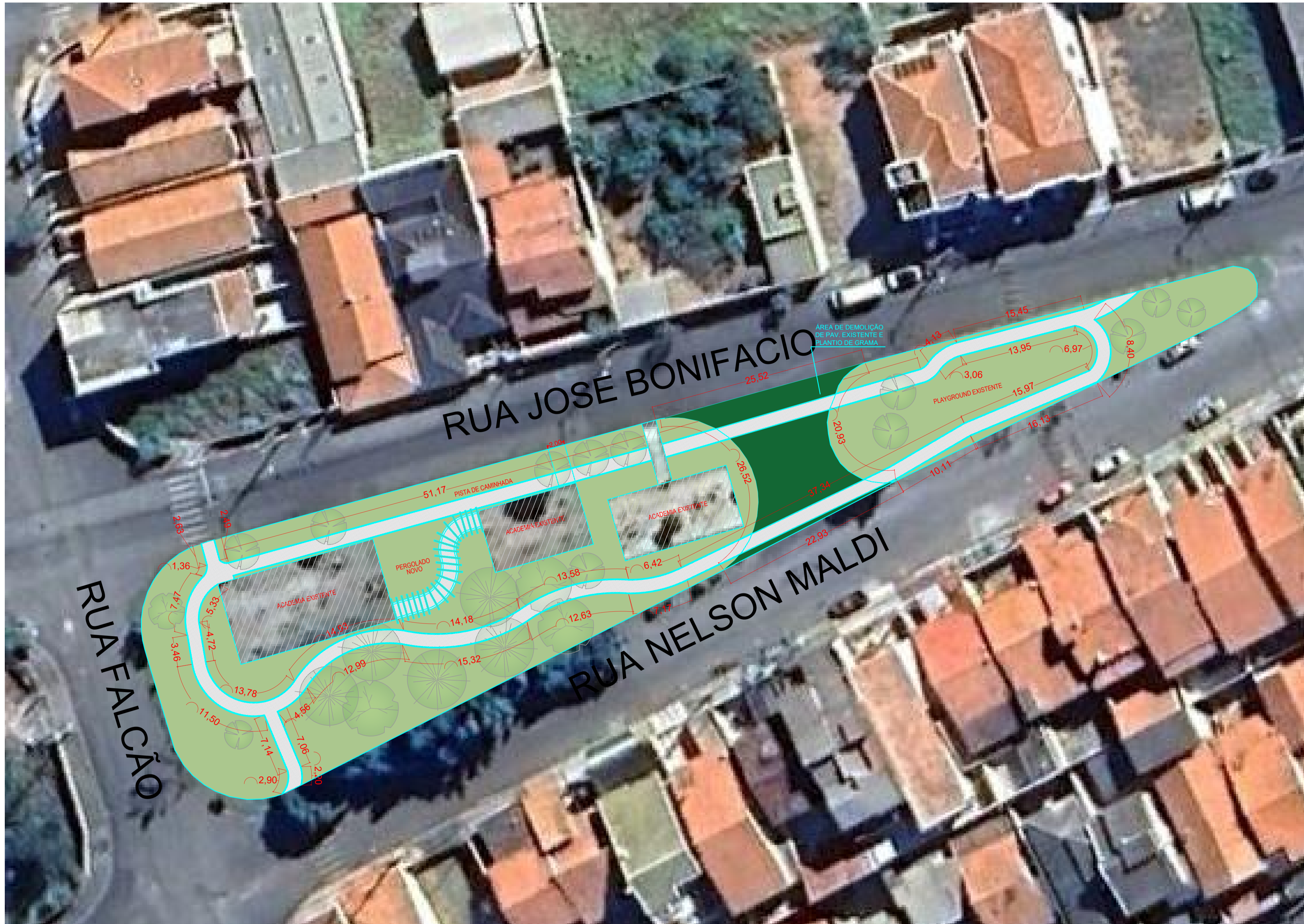
PLANTA BAIXA ESC: 1/250